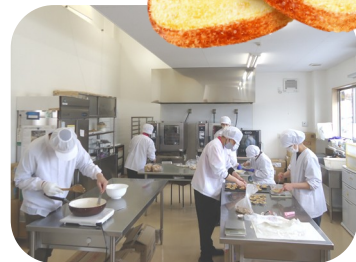
【作業中の利用者さんの様子】

二本松市安達にある「NPO法人アクセスホームさくら」は、平成13年に浪江町で小規模作業所として設立され、平成21年からは就労継続支援B型事業所として自動車部品の組立作業などの活動をしてきました。その後、東日本大地震による原発事故で避難を余儀なくされましたが、二本松市で事業を再開し、新たに菓子製造をスタートさせました。さらに昨年1月には同施設内に販売店舗「菓子工房さくら」をオープン、現在は24名の利用者さんが通所しています。